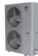
Condenseur 64 000 BTU/h